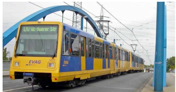
Was andere Regionen längst haben, soll endlich auch in den Kreisen Reutlingen und Tübingen Realität werden: Eine moderne Stadtbahn.