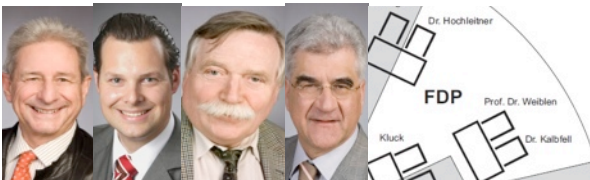
der FDP-FRAKTION IM GEMEINDERAT DER STADT REUTLINGEN